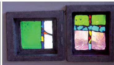
Mormont, André Bréchet

Visites guidées & renseignements • Führungen & Auskünfte Jura Tourisme: 032 432 41 80 juratourisme.ch • SIRAC: lesirac.ch