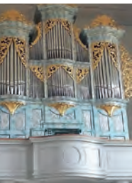
Eglise des Jésuites

Orgue de l'Église des Jésuites, Porrentruy, 1985, Jürgen Ahrend. Orgue de la Collégiale, St-Ursanne, 1776, Jacques Besançon, restauration Bertrand Cattiaux. Orgue flamand, Beurnevésin, 2019, Bertrand Cattiaux.